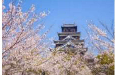
はる ひろしまじょう さくら 春の広島城と桜