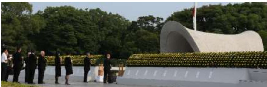
へいわきねんしきてん いれいひ みず しみん 平和記念式典で慰霊碑に水をささげる市民

かくへいきはいぜつ せかいこうきゅうへいわ じつげん ねが へいわせんげん せかい ほんしん 核兵器廃絶と世界恒久平和の実現を願って、「平和宣言」を世界に発信 しています。